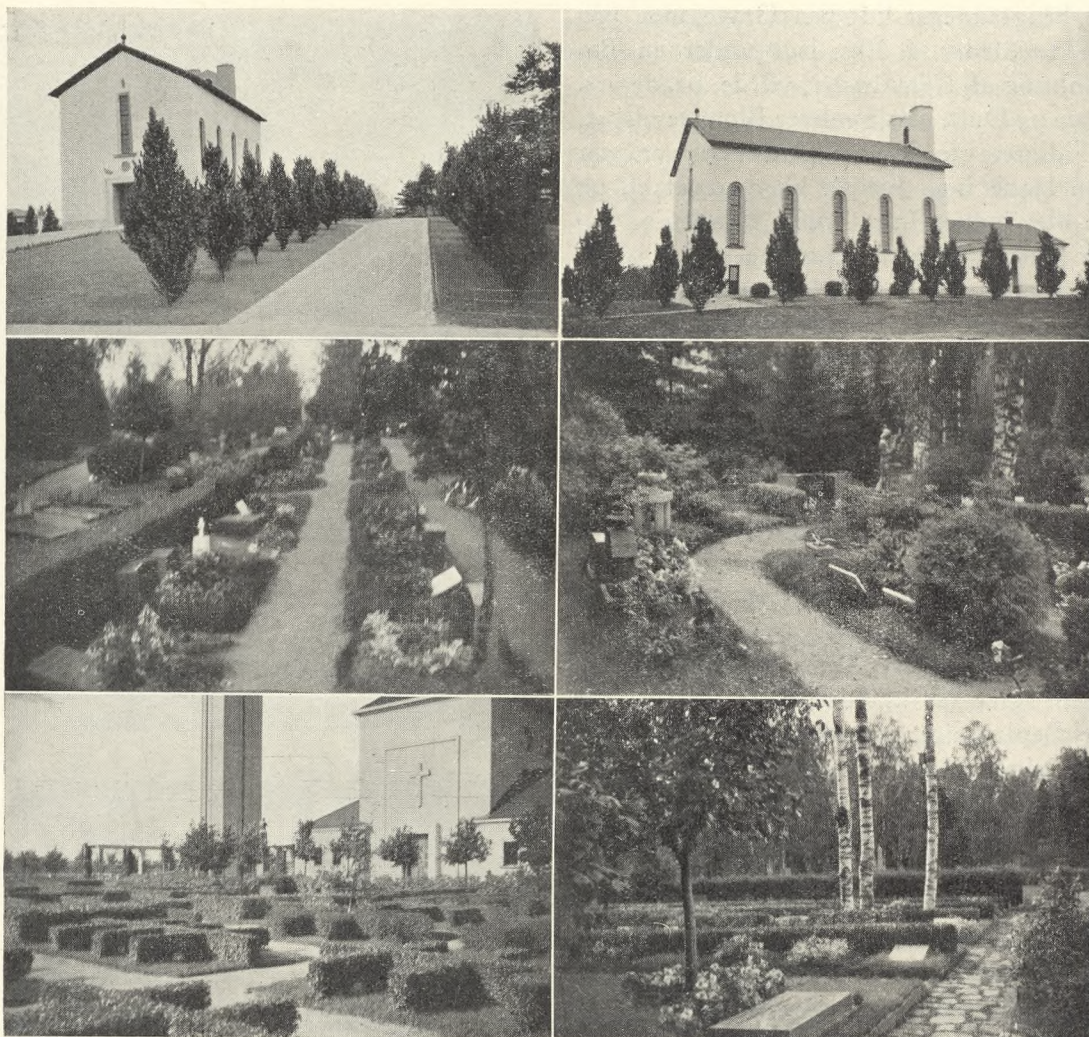
Fig. 12. Partier fra Kremato- riet i Helsingfors og Urnehave og Kirke- gaard derved.