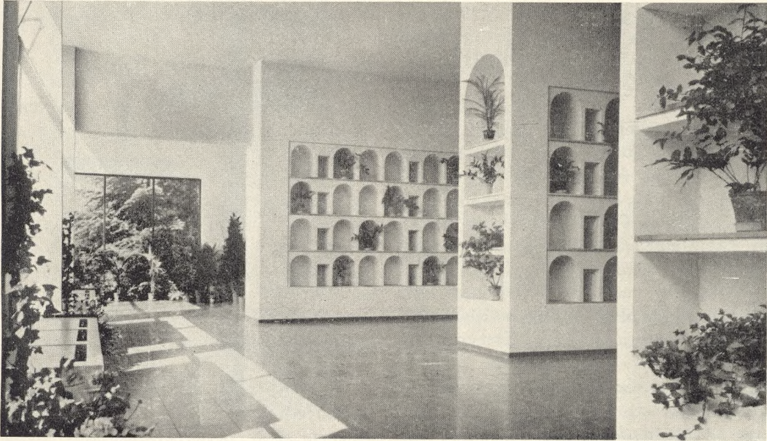
Fig. 132. Indre af Columbariet paa Søndermark Kirkegaard.