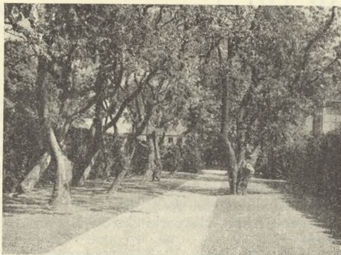
Gamle Frugttræer fra »Vintappergaardens« Have paa Mariebjerg Kirkegaard.

delse udføres af de lavestbydende efter Havearkitekt E. Böttigers Tegning.