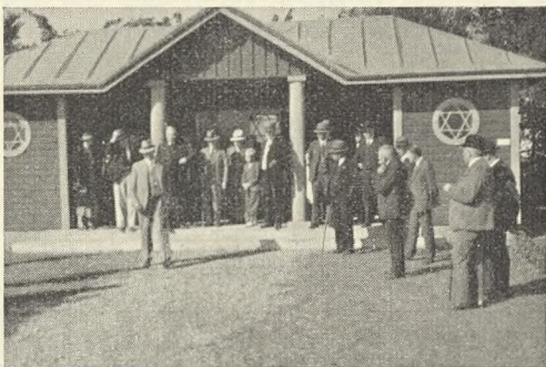
Besøg paa den nye Kirkegaard i Ribe (27. 8. 1936).

I Begyndelsen af dette Finansaar (1936—37) har der været ført en Del Forhandlinger med den ret unge Forening af Landsbygravere. Denne Forening har hidtil hovedsagelig helliget sig den indre Organisation af sin egen Forening, men ganske naturligt har den, efter at dens Forening er kommet godt i Gang og tæller ca. 800 Medlemmer, indset, at ogsaa et Oplysningsarbejde vedrørende Kirkegaardenes Forbedring og Forskønnelse var paakrævet. Man arbejder her saaledes paa samme Front som vor Forening, og det maa anses for rimeligt, at Forhandlingerne resulterer i et positivt Samarbejde til fælles Bedste. Landsbygraverforeningens Frederiksborg Amts Afdeling har bedt vor Sekretær at holde Foredrag med Foreningens Lysbilleder i Hjørulunde i Slutningen af August, og