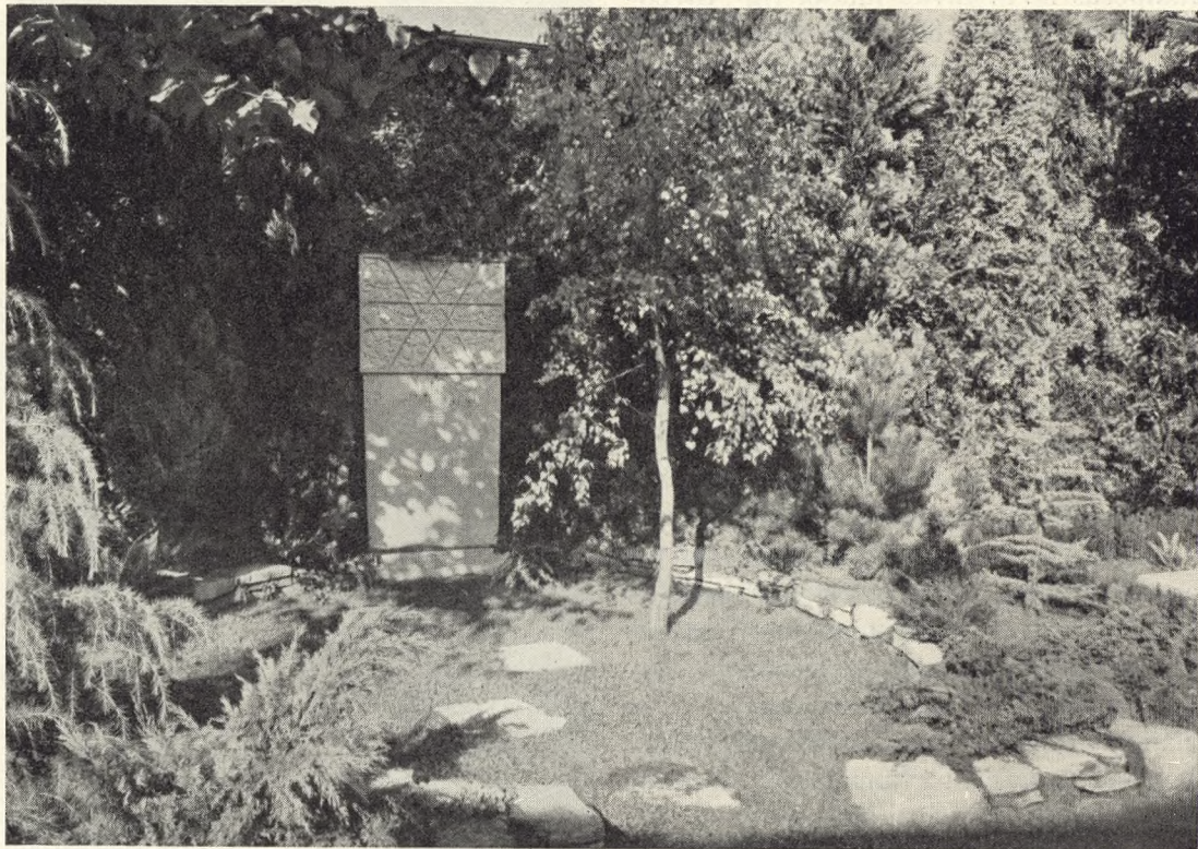
113. Bunddække: Græs. Mur af Nexø Sandsten. Mon.: E. Nielsen.

De afbildede Gravsteder er alle arrangeret af Københavns Begravelsesvæsen og Fotografierne er optaget af Elfelt .