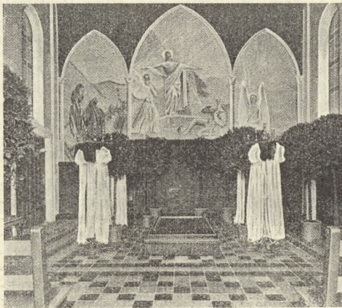
Kapelsalen i Aalborg Krematorium.