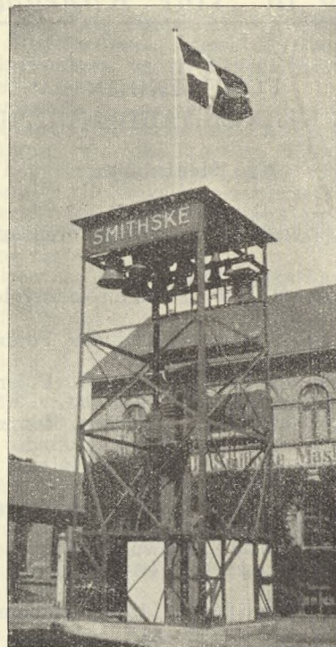
Klokkerne til Klokkespillet i de Smithske Støberier.

sulenter, og efter at de almindelige Bestemmelser om denne Virksomhed var revideret, skete dette ogsaa. Hr. N. naaede imidlertid ikke at faa gjort Brug af denne Tilladelse, idet han kort efter afgik ved Døden.