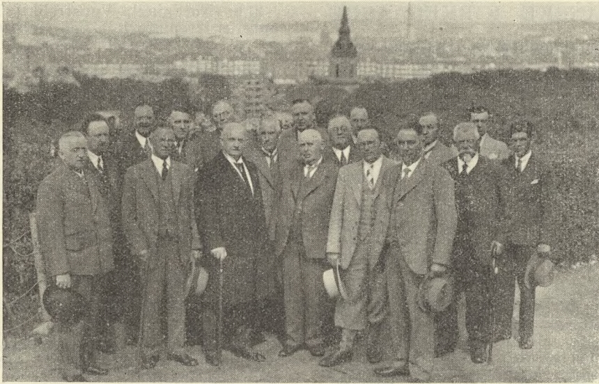
Nogle af Deltagerne i Udflugten.