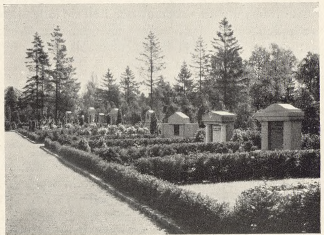
20. Ensartede Hække og Gravmæler, undergivet regulerende Bestemmelser, Københavns Vestre Kirkegaard.

For mange står kyrkjegardane som det beste døme på sit folks kultur, medan andre bryr seg lite um korleis gravene ser ut. Ein ting er i all fall visst, og det er at ei velsteld grav er eit av dei finaste ettermæle ei kvinne eller ein mann kann få. Det syner at dei i livet hev stelt seg slik at dei liver vidare i minnet til deim som stod dei nær.