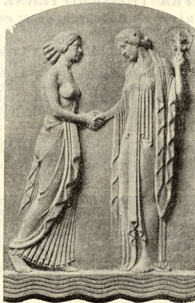
Fig. 7. Skulptur af Ragna Schlyter i Helsingborg Krematorium.