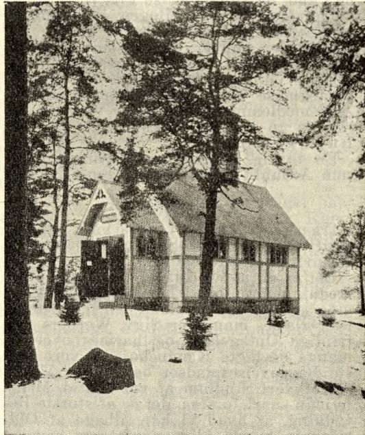
Fig. 6. Sveriges første provisoriske Krematorium i Hagalund (1882).

ske Bog, men er overmaade rig paa Oplysninger om den nyere Tid. Der afbildes Verdens første Krematorium bygget i Milano 1876 (se Fig. 5) samt det første provi-