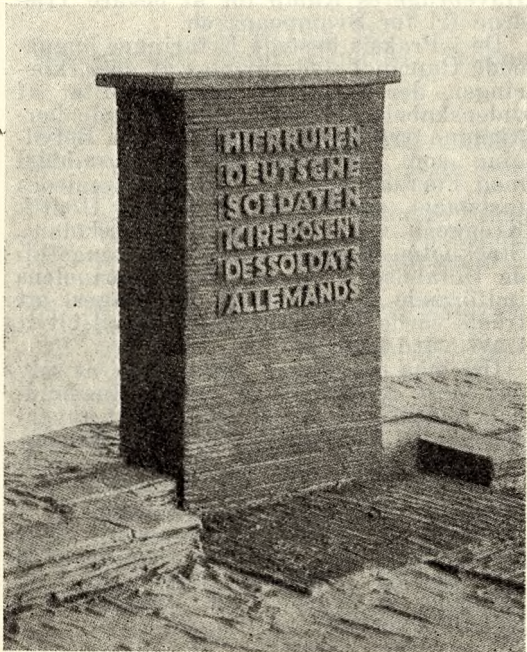
Fig. 2. Model med Skrifftype.