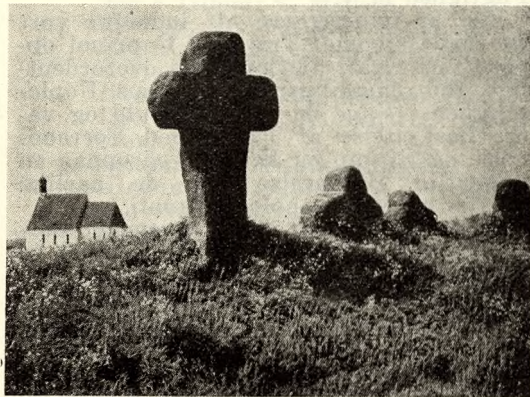
Fig. 4. Stenkors ved „Wolfram“, Eschenbach.