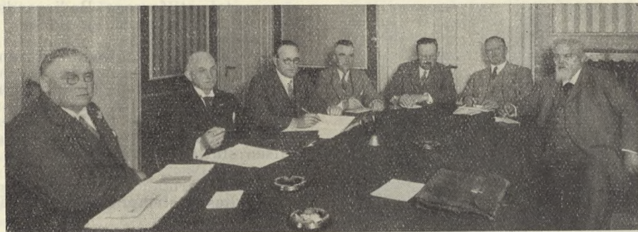
Bestyrelsesmøde i Roskilde den 17. Juni 1931.