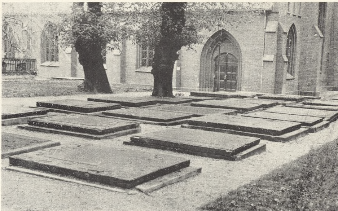
Gamle Gravsten ved Klosterkirken i Horsens.