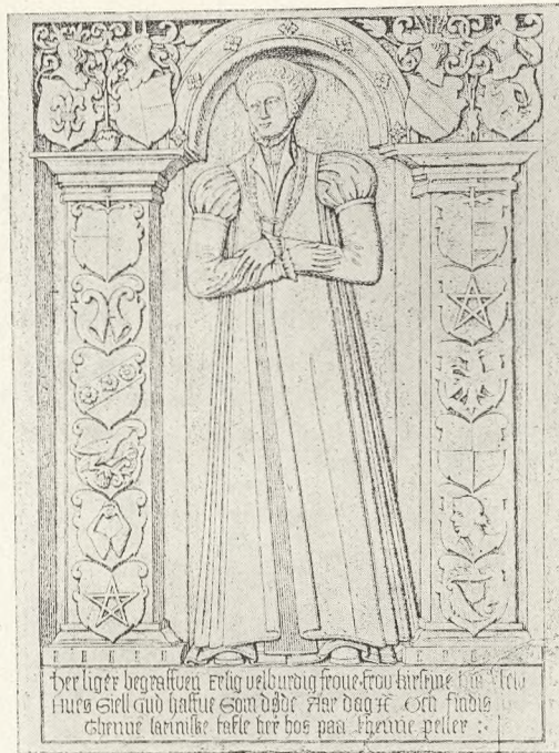
Fru Kirstine Hvitefeldt † 1563.