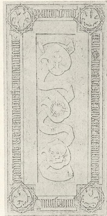
Olaus Andreae † 1527.