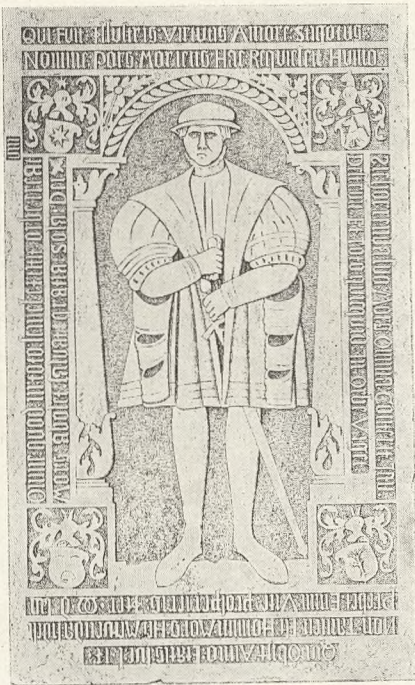
Stig Pors † 1556.