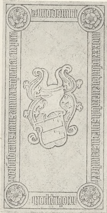
Cunibertus Jacobi † 1531.