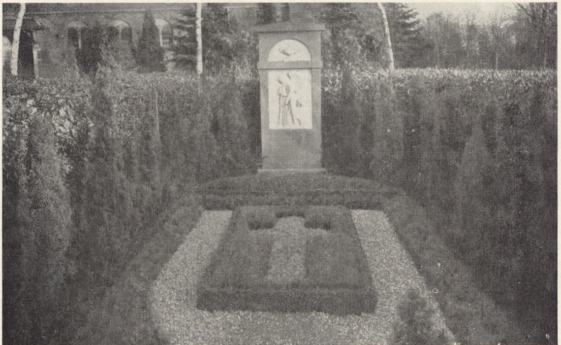
Granpyntning. Vestre Kirkegaard, København.