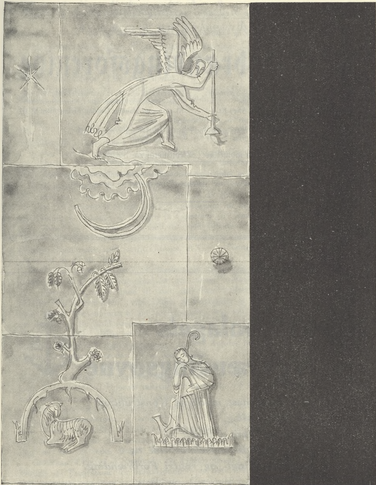
Ståhr Nielsen: Relief paa en Broncedør (Motiv: Natten).