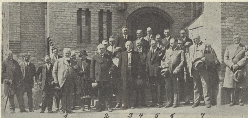
Deltagerne i Rundturen i Odense d. 17. Juni, fotograferet ved Fredens Kirke.