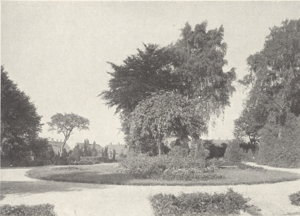
Lighus og Parti af Runddelen paa Hillerød Kirkegaard. Foto 1929.