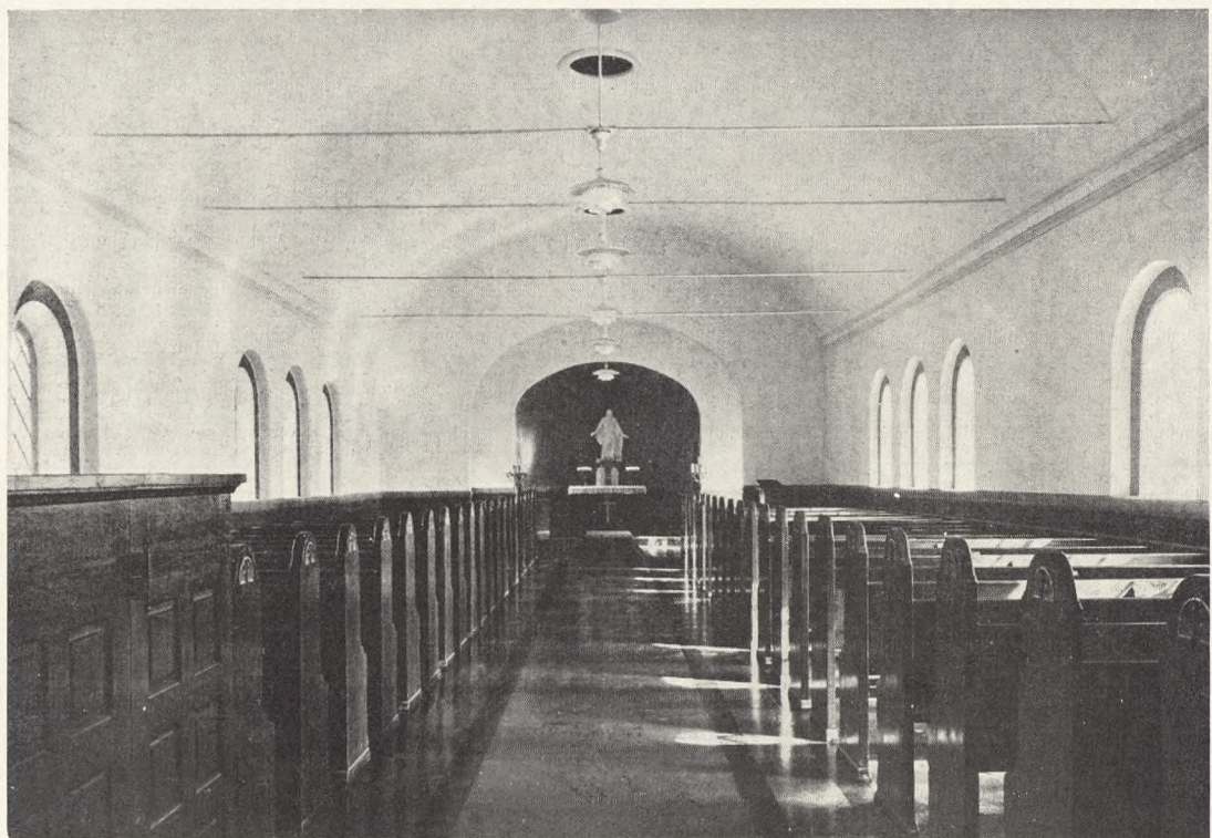
N. P. Nielsen: Kapel paa Hillerød Kirkegaard. Foto 1929.