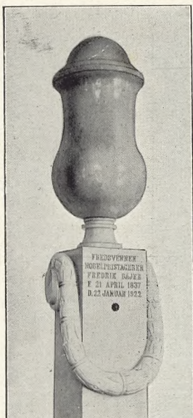
Holger Jacobsen: Urne for Fredsvennen Frederik Bajer. Bispebjerg Columbarium.

overfor Sagen, men sendte den straks videre til Kultusministeriet, fra hvis Side der nu blev rejst en voldsom Bevægelse mod Ligbrændingssagen (se senere). Til Trods for at Bevægelsen fik Støtte gennem Udtalelse fra „Den almindelige danske Lægeforening“s Møde i Kolding den 26. August 1881 og gennem Sundhedskollegiets Erklæring af 23. September 1881, mente Justitsministeriet ikke at ville optræde mod Kultusministeriets Modstand, og gennem Skrivelse af 15. Juni 1881 meddeltes dette Foreningen.