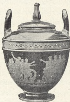
Urne med Motiv fra Charons Færge. A/S P. Ipsens Enke. Kgl. Hof-Terracottafabrik.

Overalt ophører Ligbrændingen paa det Tidspunkt, da Kristendommen træder ind som sejrende Tro, i Syden i 3.-4. Aarhundrede, i Norden ved Aar 1000. Men Sædvaner fra hedensk Tid holdt sig meget længe og er næppe nok endnu helt forsvundne, i hvert Fald ved ubrændt Gravlægning, hvor man f. Eks. endnu kan spore den Charons Færges , der havde sin gode Forklaring ved den ubrændte Gravlægning i Grækenland, men som oftere er fundet i Urner i Mellemeuropa, og som sikkert dér var lige saa blottet for virkelig Motivering, som naar den findes i sjællandske Skeletgrave fra Folkevandringstiden. Sæd og Skik varer længe ved, ganske særligt i Forholdet til de Døde.