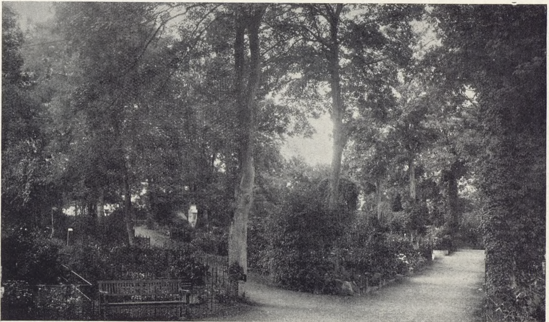
Øverst: Soldatergrave fra de slesvigske Krige, smykkede paa Kristi-Himmelfartsdag. Foto 1926. Nederst: Parti mod Højen, Kirkegaardens ældste Del. Foto 1926.