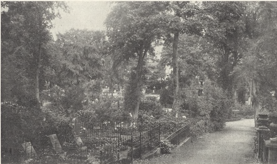
Øverst: Soldatergravene. Foto 1926. Nederst: Parti fra Kirkegaardens ældre Del. Foto 1926.