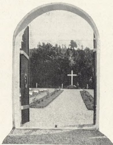
Den sønderjydske Kirkegaard i Braine. Kig gennem Porten.

Det var en Stund af betagende Højhed og hjertegribende Alvor for alle tilstedeværende, en særegen gribende Oplevelse, der aldrig vil glemmes.