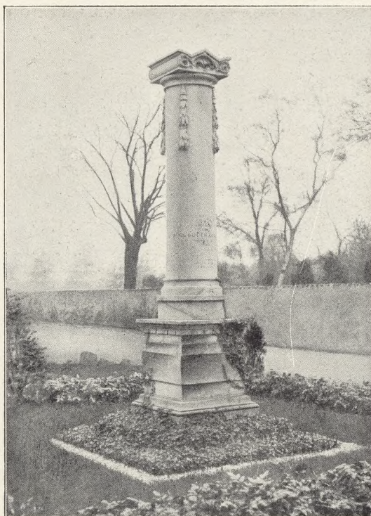
Gravmæle paa Assistens-Kirkegaard i København. Udført af Johs. Wiedewelt.

stadbeboerne længe havde næret, sig nu tillidsfuldt mod Kirkegaardene. Almuens hittidige Søndagsfornøielse, at „gaa paa Kærregaarden“, der havde bestaaet i at tilbringe Tiden med forskellig Slags Morskab i det frie paa de spredte Kirkegaardstomter i Byerne, antog nu den smukke Form at sørge for Gravene, og-saa paa de uden for Byerne oprettede Kirkegaarde. Som en Slags „Kolonihaver“ vinkede nu disse Mængden ud til sig. Ingen var længer saa fattig, at han jo havde sin lille Plet Jord derude, hvortil et eller andet knyttede ham; selv den ringeste kunde faa sin Part af Glæden ved at pleje med kærlig Haand. Den smukt holdte Kirkegaard blev en Naturforsoning med Døden. Som bekendt er disse Forhold, om end ud fra andre Synsmaader, fremdeles i Vækst Norden over. Kirkegaardenes Ydre nærmer sig efter tre Hundrede Aars Forløb atter den Tilstand, som blev afbrudt ved Reformationens Indførelse.“