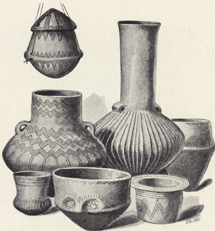
Lerurner fra Broncealderen