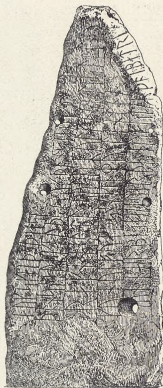
Runesten fra Tryggevælde

Begravelsen foregik derfor hurtigt efter Døden, som oftest inden 24 Timers Forløb. Ligkister kendte man ikke, men Liget blev lagt paa en Baare og blev af den Afdødes Standsfæller paa Skuldrene baaret til Graven, enten denne var den Døde beredt inde i selve Kirken eller paa Kirkegaarden uden om.