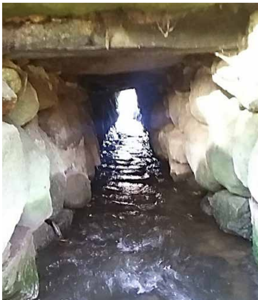
Indre af stenkiste 1, set fra nordlige udløb.