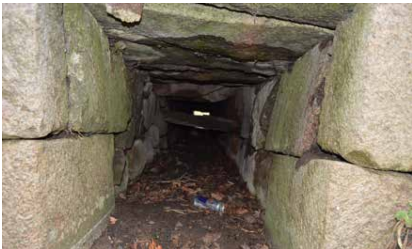
Stenkiste Slagelse Landevej 139/141 set fra sydøst. Man ser de fint tilhuggede stenkvadre yderst, og groft tilhuggede indvendig.

tilhugne kampesten. Stenkisterne er dermed væsentlig flottere end flertallet af de 10-tusindvis af stenkister, som efter Englandskrigene og statsbankerøt-