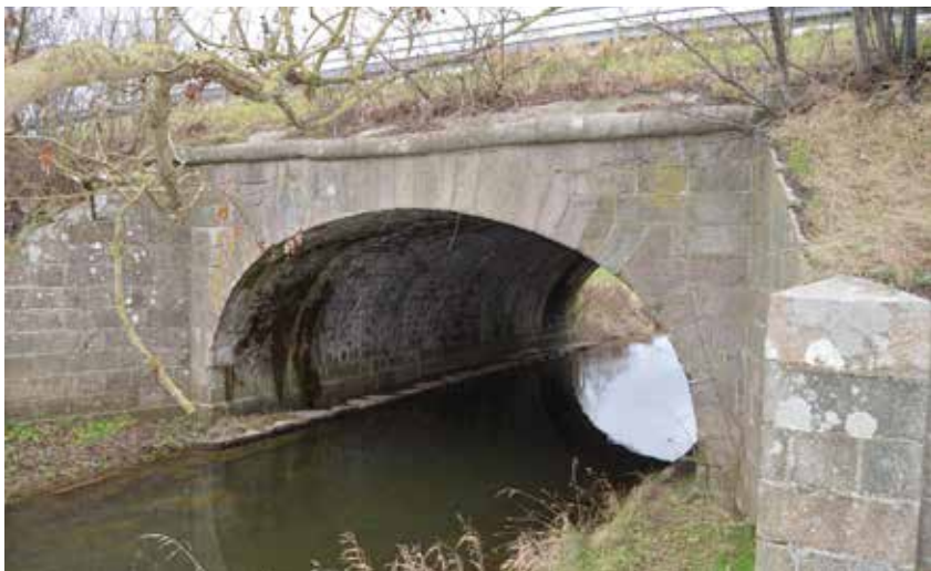
Den fredede Vårby Bro fra 1785.