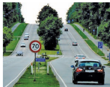
Geels Bakke ved København 1851 malet af Andreas Juuel og fotografi fra 2020.

Tidsskriftet udgives af Dansk Vejhistorisk Selskab to gange om året, hvor det sendes til selskabets medlemmer.