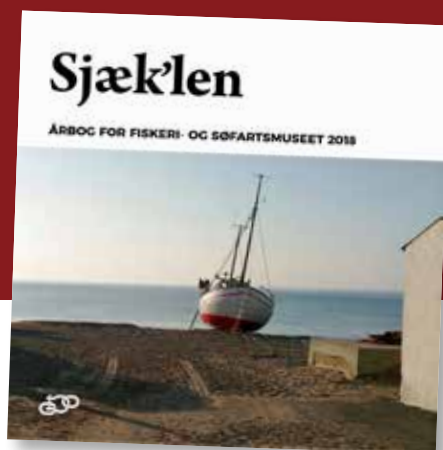
Broen til Fanø. I: Sjæk'len 2018, Årbog for Fiskeri- og Søfartsmuseet, Esbjerg, 2019 ISBN: 978-87-909982-88-1 ISSN: 0904-1923.

til det danske Vadehavet, et område af stor betydning for bl.a. fuglelivet.