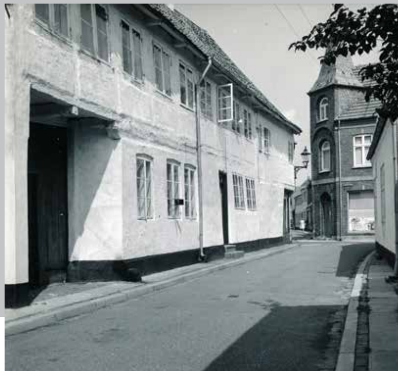
Fig. 8. Fotografi fra samme vinkel som fig. 7, men senere, for nu er gaden belagt med asfalt. Brostensbelægningen underneden titter frem i siderne af asfaltbelægningen.

stykker lå med ca. 15 meters afstand og viste sig at være fra samme træ, som blev fældet ca. år 1215. Deres stratigrafiske placering knytter dem til de yngste faser af plankeveje. Dette kan være med til at underbygge antagelsen om organiserede belægningsprojekter, hvor man udbedrede og udskiftede plankevejene, og samtidig måske sørgede for styring af spildevand fra de tilstødende matrikler. 15