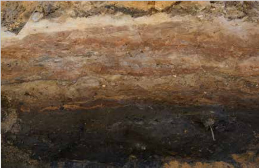
← Fig. 5. Sættelag fra plyndrede pikstensbelægninger i en af kloakgrøftens længdeprofiler i Sviegade.