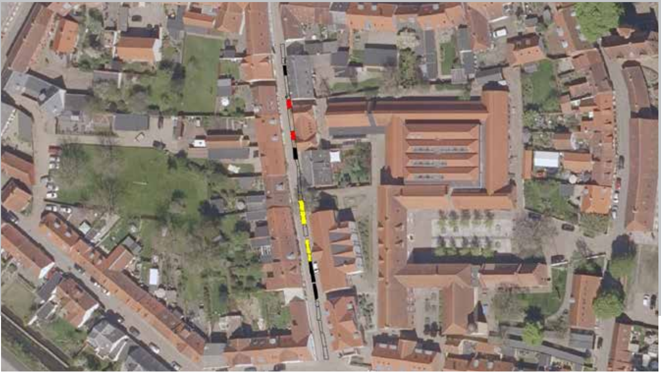
Fig. 21. Kloaktracéet i Sviegade på luftfoto over Ribe. Røde felter markerer, hvor der fundet produktionsaffald fra benskærerarbejde, mens de gule felter markerer, hvor der er fundet affald fra skoproduktion. Illustration Sydvestjyske Museer.