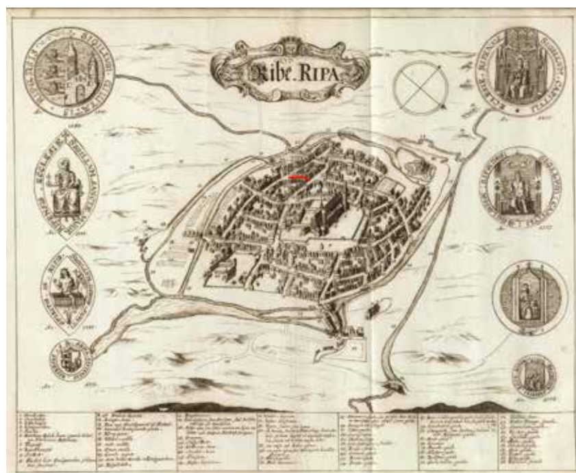
Fig. 1. Forlægget til Resens Atlas af Ribe fra 1677. Sviegade markeret med rødt.

I dag ligger Sviegades højeste punkt, hvor den møder Sønderportsgade i nord,