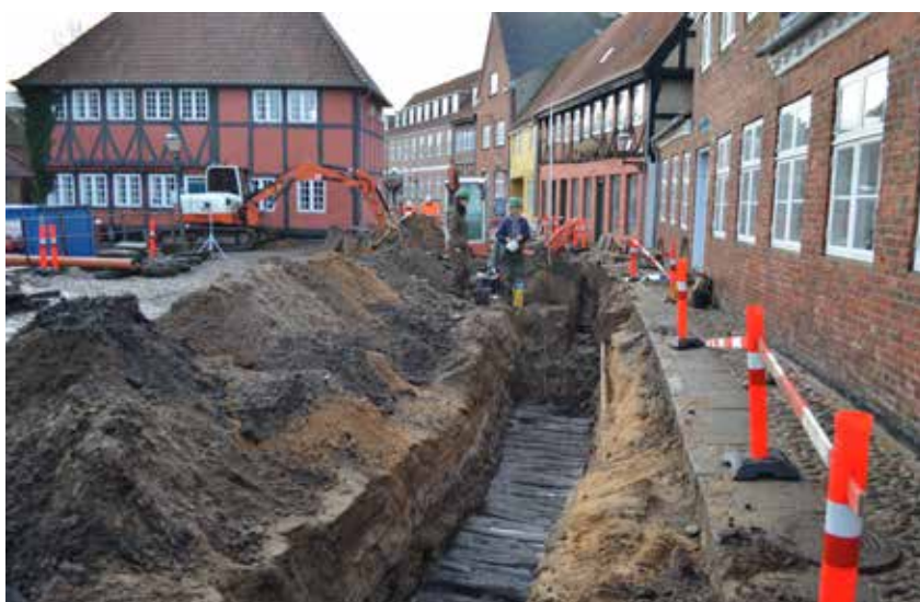
Fig. 4. Næsten intakt plankevej i Skolegade i Ribe fundet under udgravningerne på Ribe Domkirkeplads ASR 2391.

I første fjerdedel af 1100-tallet belagdes Sviegade med træ. De såkaldte plankeveje bestod først af kraftige, tværliggende planker fæstnet på langsgående remme, der lå oven på jorden. I takt med, at de bløde kulturlag voksede, blev det nødvendigt at fundere plankevejene på rækker af stolper, der var gravet eller rammet ned til det faste under-