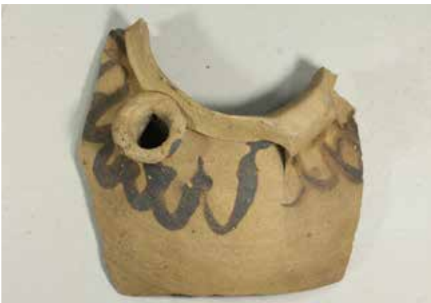
Fig. 11. Flot skår med mundingsrand og tud samt rød bemaling fra en kande af Pingsdorf-typen produceret i området omkring Köln i 1100-tallet. Fundet i Ribe.