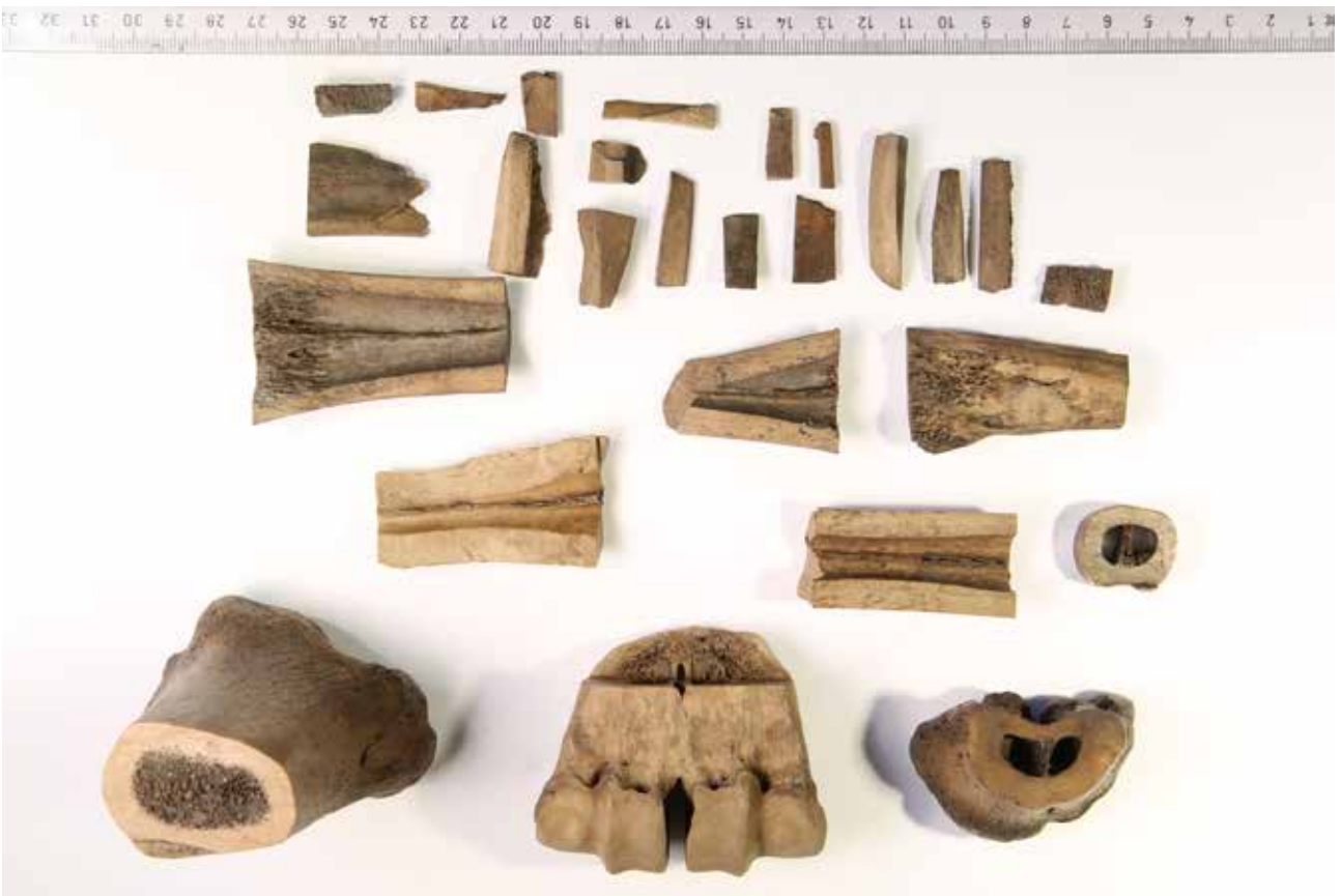
Fig. 15. Samling af produktionsaffald fra benskererarbejde fundet i Sviegade.