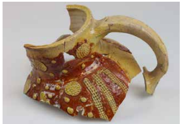
Fig. 12. Næsten intakt kande med grøn glasur og randskår med hank og rød glasur. Begge af Rouen-typen produceret i det nordfranske område i 1200-tallet. Fundet i Ribe.

Den store mængde knogler er sandsynligvis husholdnings- eller slagteaffald og viser, hvordan gaden er blevet brugt som skraldespand og illustrerer fint, hvorfor middelalderens kulturlag er blevet så tykke i manglen på egentlig affaldshåndtering. Flere af knoglerne havde spor efter slagtning, og et hestekranie med to, firkantede læsioner på næseryggen var uden tvivl aflivet ved at blive slået for panden (se fig. 10).