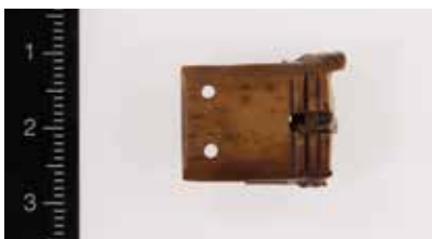
Fig. 18. Fragmenteret bæltespænde af ben eller tak fundet i Sviegade.