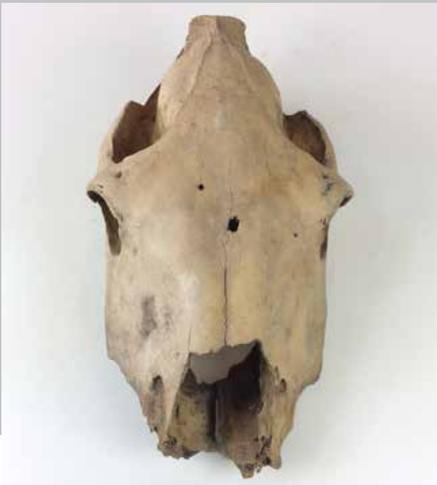
Fig. 10. Hestekranie fundet i Sviegades kulturlag. På næseryggen ses to læsioner efter slagtning.