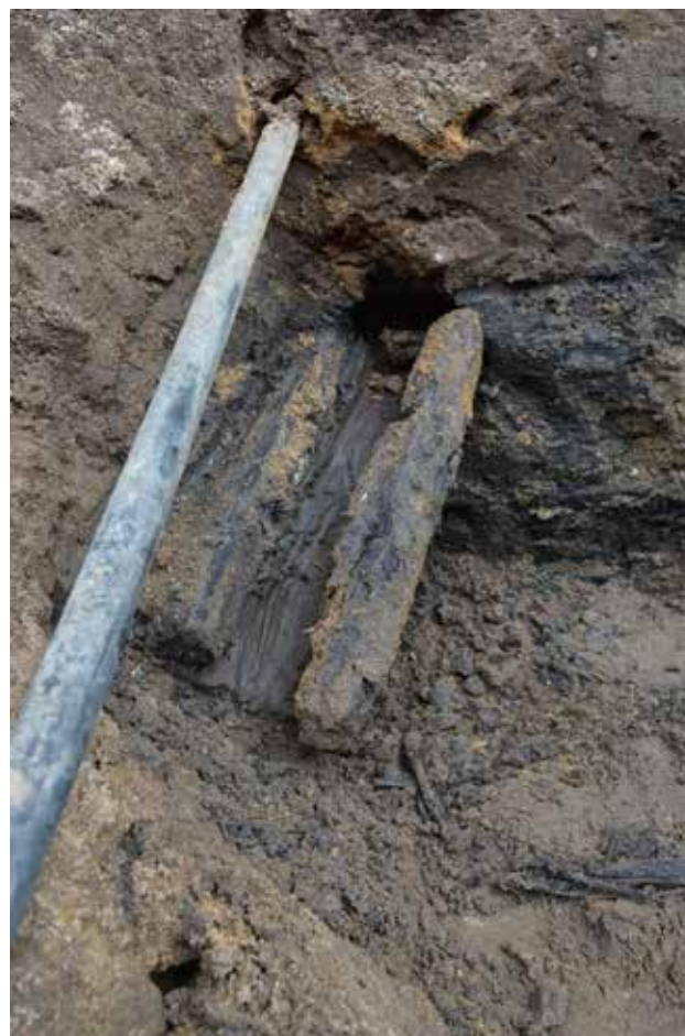
Fig. 9. Halvtømmer af eg med rende i midten fundet i Sviegade. Tømmerstykket har fungeret som afløb fra et hus i middelalderen og blev dateret til en fældning omkring 1215 e.Kr.

De metertykke, organiske kulturlag fra 1100- og 1200-årenes Ribe er ekstremt rige på fund, og lagene i Sviegade var ingen undtagelse. De steder, hvor anlægsarbejderne forstyrrede urørte kulturlag, blev jorden taget op i sække til vandsoldning, hvor den skylles igennem med vand over et net med en maskestørrelse på 4 mm. Fra denne jord kom over 6000 genstande foruden hele 56 kg knogler fra husdyr og fisk.