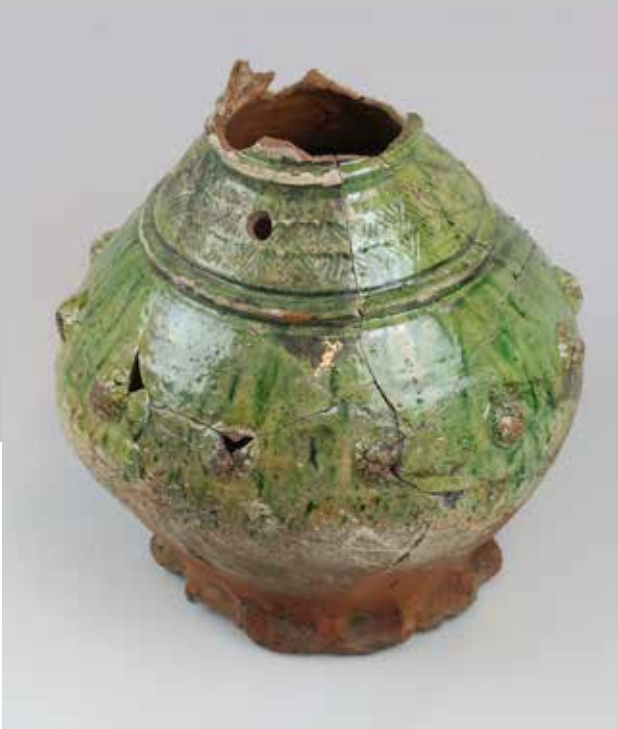
Fig. 13. Næsten intakt kande af flamsk type med rødbrændt gods med rullestempelornamentik, hindbærknopper og grøn glasur på hvid pibeltersbegitning. Produceret i Flandern i 1200-tallet. Fundet i en brønd i Ribe.