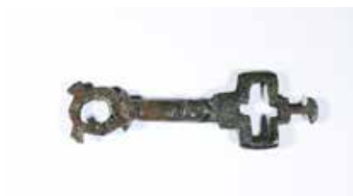
Fig. 19. Nøgle og bæltespænde i kobberlegering fundet i Sviegade.