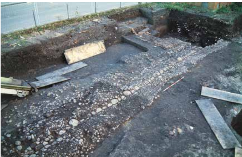
Fig. 6. Velbevaret rest af vejbelægning i piksten med rendesten i midten sat i større sten. Fundet på udgravningen ASR 12 Bakelitten.

Tidligere udgravninger i Ribes gader har vist, at plankevejene i anden halvdel af 1200-tallet blev afløst af pikstensbelægninger af utildannede natursten. Det samme var tilfældet i Sviegade, hvor de yngste rester af plankevej overlejredes næsten direkte af sætte- eller afretningslag af sand til pikstenbelægninger. Som det er reglen i Ribe, hvor sten ikke optræder naturligt i undergrunden, var brolægningerne i Sviegade plyndret, så kun de underliggende sandlag var tilbage (se fig. 5). Stenene er blevet pillet op og genanvendt i de efterfølgende brolægninger, men i enkelte tilfælde kan man være så heldig at finde rester af de yngste pikstensbelægninger (se fig. 6). 14