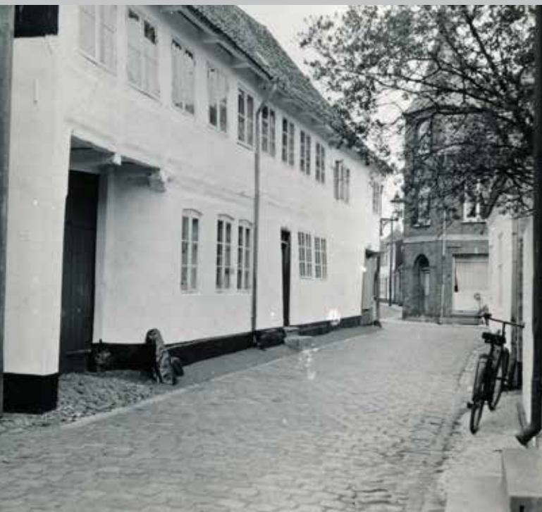
Fig. 7. Fotografi af den nordligste ende af Sviegade med belægning af brosten. Man kan stadig se små områder med piksten i kanten af belægningen.