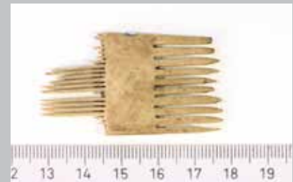
Fig. 17. Fragmenteret dobbeltkam og langtandskam fundet i Sviegade.