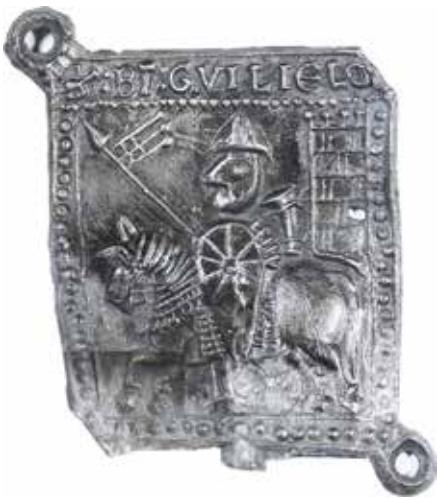
Fig. 20. Pilgrimsmærke fra klosteret Saint-Guilhem-le-Désert i det sydlige Frankrig fundet i Sviegade.

I Sønderportsgade, som Sviegade er en sidegade til, var affald fra håndværk stort set fraværende. Til gengæld var der her et indslag af smykker, pynt til klædedragt, enkelte skår af luksusvarer som islamisk keramik og hulglas samt en større andel af importeret keramik. 20 Små glimt af en lidt højere levestandard, som måske viser, at hovedstrøget Sønderportsgade har haft et lidt mere privilegeret klientel, hvor man i højere grad ernærede sig ved handel, mens beboerne i Sviegade ernærede sig ved de mest almindelige håndværk.