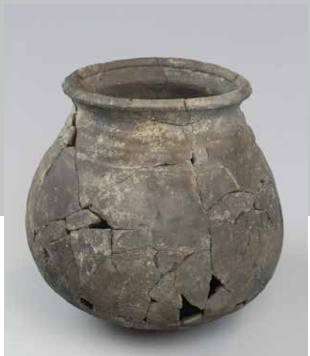
Fig. 14. Hjemligt produceret kuglepote af gråvare med drejeriller på overgang til hals. Ledetype fra 1300-tallet. Fundet i Ribe.