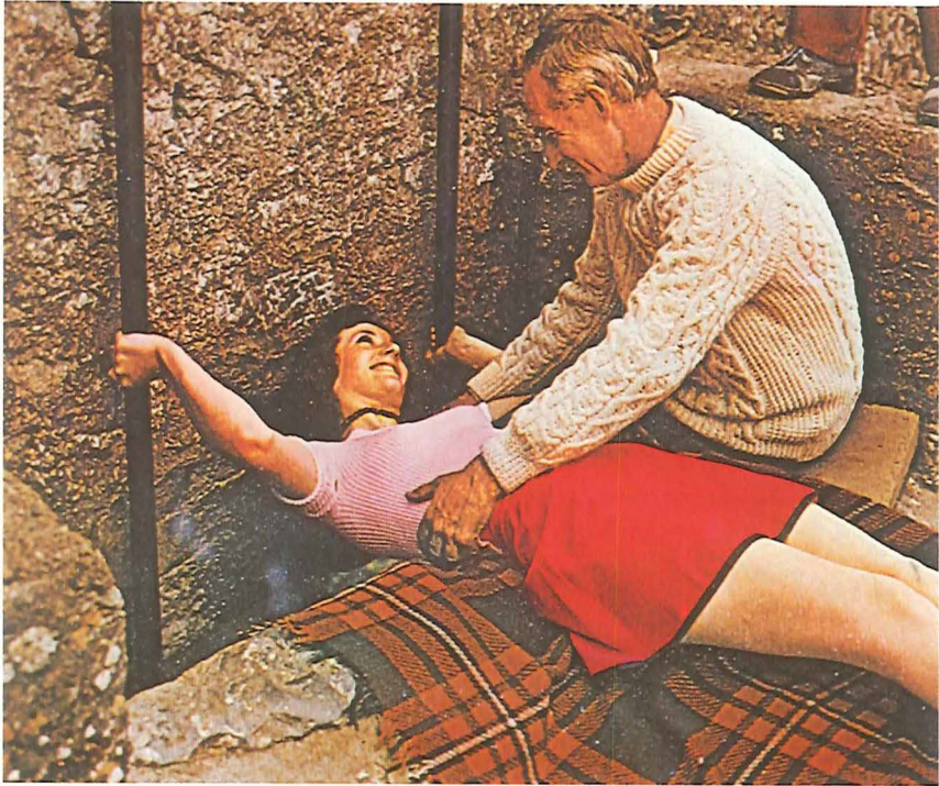
Kissing the Blarney stone.

denne meget, siger, at det var kongen af Syd Munster, Dermot MacCarthy, der reddede den gamle kone. Dette flytter historien til det 10. århundrede, da den første bygning på stedet blev lavet. Denne var af træ, og derfor må historien være yngre. Det andet slot blev bygget år 1200 og var lavet af sten, rester af dets granitfundament indgik som fundament i det tredje, hvortil tårnet hører.