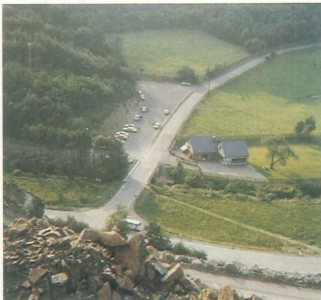
Udsigt fra stenbruddet Juchem. Bygningerne er vandmøllesliberiet Geracher Wasserschleife, ved vandløbet Fischbach, og bilerne på parkeringspladsen tilhører stensamlere på besøg i Juchem. Foto Rosa Steffens, 1980.

agat er fundet af udvandrere fra Idar. I begyndelsen af 1860erne begyndte man også at indføre ametyst og bjergkrystal fra Brasilien, og i forbindelse hermed begyndte man med facetslibning på sandstenshjulene, men det var dog først i 1871 at egentlig smykkestenslibning på horisontale metalskiver blev indført. Den første diamantsliber nedsatte sig i Idar 1886.