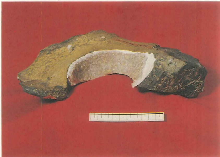
Ametystdruse fra stenbruddet Setz. Målestokken er 10 cm.

ca. 5 km nordøst for Idar. Lige overfor stenbruddet Juchem ligger også et stadig virksomt vandmølleliberi Geracher Wasserschleife, drevet af vandløbet Fischbach. I stenbruddene kan man ved hjælp af tålmodighed og en stor hammer finde pæne stykker af agat, jaspis og ametyst. Ametysterne i Idar-området er dog svagere blåfarvet end de brasilianske ametyster.