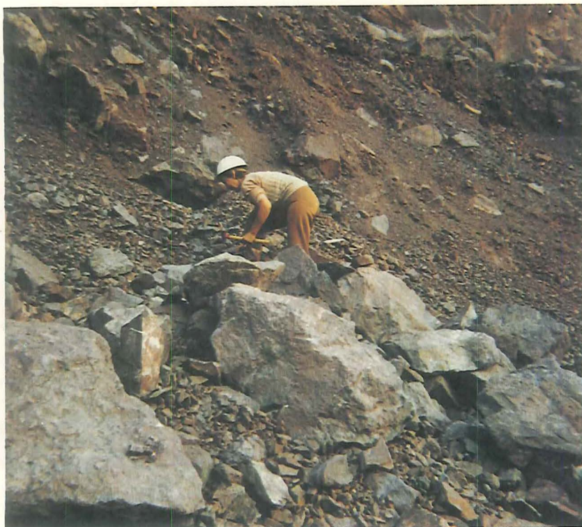
På jagt i stenbruddet Juchem. 1980.

stenbruddene biler fra ind- og udland med ivrige stensamlere. Så snart arbejderne er kørt ud, rykker de ind i bruddene, en del med hjelme, mukkerter og brækjern.