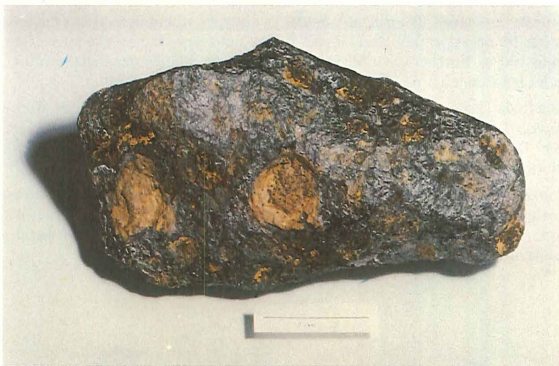
Figur 3. Muonionalusta III (Naturhistorisk Rigmuseums samling, Stockholm).

Den anden interessante oplysning man kan få, er en meteorits jordiske alder, det vil sige hvor lang tid siden det var at den faldt ned. Alderbestemmelsen gøres ved hjælp af de radioaktive isotoper beryllium-10 og klor-36. Når en meteorit svæver omkring i rummet holdes dannelse og nedbrydning af et radioaktivt atom i ligevægt. Når meteoriten er faldet ned sker bare nedbrydning. Tyskeren Wänke og hans medarbejdere bestemte ligevægtsforholdet på "friske" nedfald og kunne derefter beregne alderen. For Muonionalusta-meteoriterne kom de frem til en alder af mere end 800.000 år. Dette er sensationelt, for det betyder, at Muonionalusta-meteoriterne må have været med til adskillige nedisninger.