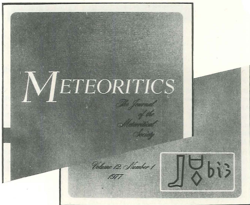
Figur 1. Forsiden til det amerikanske tidsskrift Meteoritics .

Holder man sig på jorden, så er jernmeteoriter mere almindelige at finde end stenmeteoriter. Det skyldes, at jernmeteoriterne er meget mere modstandsdygtige over for forvitring end stenmeteoriterne. I de gamle kulturlande findes imidlertid ingen jernmeteoriter, fordi man der har anvendt alt det jern, som er dukket frem af jorden under landbrugsarbejde og lignende. Allerede de gode gamle ægyptere kendte til den slags jern længe før jernalderen, og idag smykkes forsiden på tidsskriftet Meteoritics af hieroglyfen for jern (fig. 1). I disse ældste tider var jern kostbarere end guld og sølv, og det fundne meteoritjern blev anvendt til kult-genstande, hvoraf flere er fundet ved udgravninger.