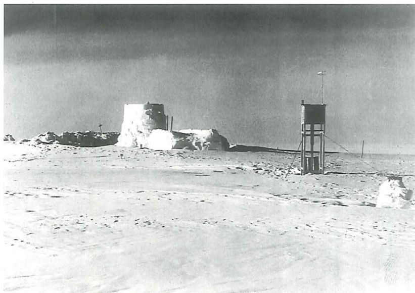
Station Eismitte, savet og udhugget i isen.