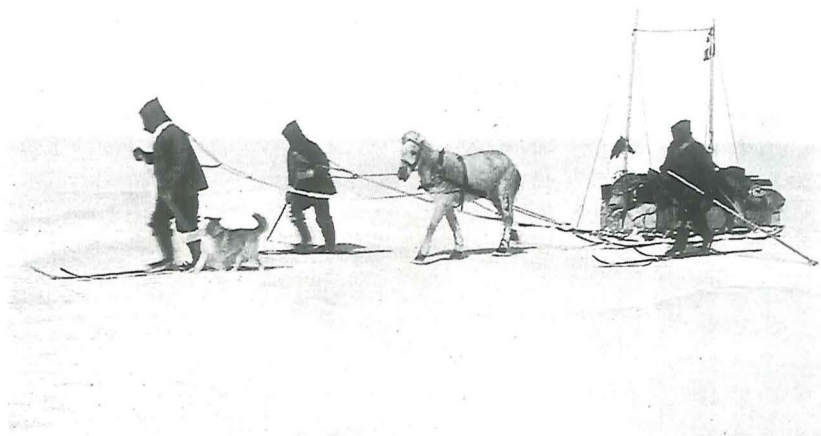
På vej mod vestkysten i juni 1913. De tre formummede skikkelser er Koch, Vigfus og Larsen.