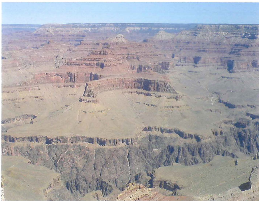
Figur 2. Grand Canyon. Stratigrafi så man får tårer i øjnene! Sen Palæozoiske sedimenter aflejret på land (klitsand med fodspor) og i havet (kalksten med diverse fossiler) – eller vidnesbyrd om syndfloden?

Stratigrafi, så enhver ku' forstå det, skulle man tro. Men nej, i nationalparkens 'visitor center' faldt de over en bog om dette storslåede naturfænomens dannelse, der godt nok kunne få dem til at spærre øjnene op. 'Grand Canyon – a different view' er bogens titel, og den falbyder intet mindre end en Bibel-baseret version af dannelsen af både kløften og hele Colorado-plateauet. Kilometervis af sedimenter, gentagen deformation, samt mere end halvanden kilometers nedskæring af selve kløften. Altsammen sket i løbet af det ene år syndfloden varede ifølge bibelens ord – sådan! Og hele historien illustreret med de mest fortryllende billeder i et lækkert lay-out. Men teksten! Her går det gruelt galt. Alle relevante geologiske basisdiscipliner er naturligvis inddraget: aldersbestemmelse, fossiler, tolkning af aflejringsmiljøer, m.v.; men den forkvaklede argumentation unddrager sig på enhver tænkelig måde en rationel, naturvidenskabelig diskussion, idet den entydigt er drevet af en klippefast TRO på at hvert eneste ord i Biblen er den skinbarlige sandhed. Her er ingen snedig kamuflage så som 'Intelligent Design' eller lignende. Næh, her er vi eksponeret for