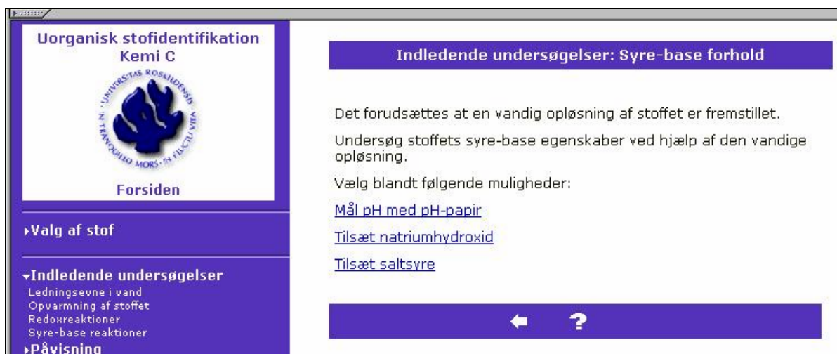
Figur 3. Efter valget mellem indledende undersøgelser (menu) skal man vælge videre mellem tre forskellige småeksperimenter.

I kursustiden introduceres de studerende til programmet og de bliver bedt om at arbejde i hold på to med det udtrykkelige formål at sikre en eksplicit dialog om hvilken rækkefølge de virtuelle laboratorieeksperimenter skal udføres og hvordan det enkelte eksperiment skal tolkes. Ud fra en konstruktivistisk synsvinkel vil dialogen nemlig være et stærkt middel i læreprocessen.