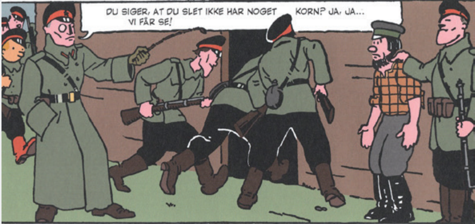
ILL.: Forlaget Cobolt 2018; anmeldereksemplar Faraos Cigarer

ka 20 mio. Folketællingerne for 1937 og 1939 blev holdt hemmelige til op i perestrojka-tiden.