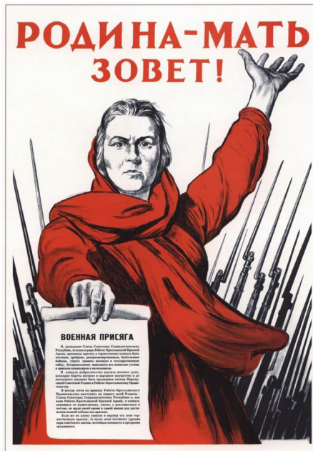
272. Троица И. Родина-мать зовет! 1941

სურათი 5: 1941 წელს მხატვარი ირაკლი თოიძის მიერ შექმნილი ომის პროპაგანდისტული პლაკატი “დედა სამშობლო გეძახის”