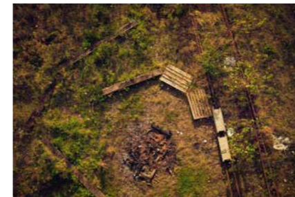
Figur 2: Stedet for interviewet.

Farvefotografiet herunder viser stedet, hvor interviewet er foregået. Sort-hvidfotografiet viser deltagerne tidligere brug af stedet.