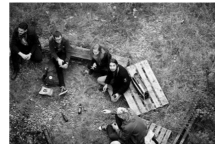
Figur 3: Forskningsdeltagerne tidligere brug af stedet.

Sammenligning af de to fotografier (figur 1 og figur 2), deltagerne udsagn og forskerens sensoriske oplevelse medvirker til at forstå, hvordan det at være netop dér, på deres sted, skaber en større forståelse for deres praksisser. Det stedssensitive perspektiv består i dette tilfælde konkret i at generere viden om, hvordan forskellige typer af materialitet er en del af disse menneskers sociale og situerede praksisser. I kontrast til det foto-eliciterede interview er det ikke blot en samtale om fotos af tidligere praksisser, eftersom forskeren skaber en erfaringsbaseret erkendelse af det sted, som de har benyttet, og hvor deres praksis har udfoldet sig. Den stedslige deltagelse gav ydermere anledning til at definere og stille spørgsmål in situ: