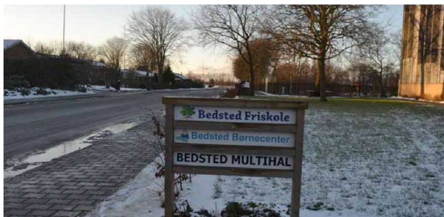
Bedsted Friskole, der startede i 2012. Ved siden af ligger Bedsted Børnecenter og Bedsted Multihal.