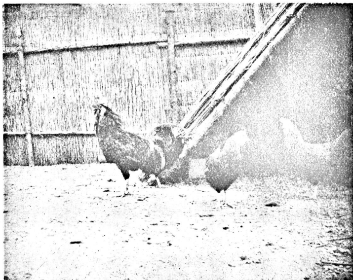
Skraberum opført af Lægter og Maatter.

gamle Maatter, der ligeledes kan anbringes som Læ paa udsatte Steder. Saavidt mulig bør Læskurets højeste Side vende mod Syd, og i alt Fald om Efteraaret og Vinteren forsynes med gamle Vinduer eller afpassede Glas, der kan indskydes i udsavede Mellemrum i Skrabeskurets Forside. Til hver 4 à 5 Høns maa regnes 1 Kv.-Meter Gulvflade. Saafremt der uden om Husets Underkant paasømmes fintmasket Staaltraadsnet, der