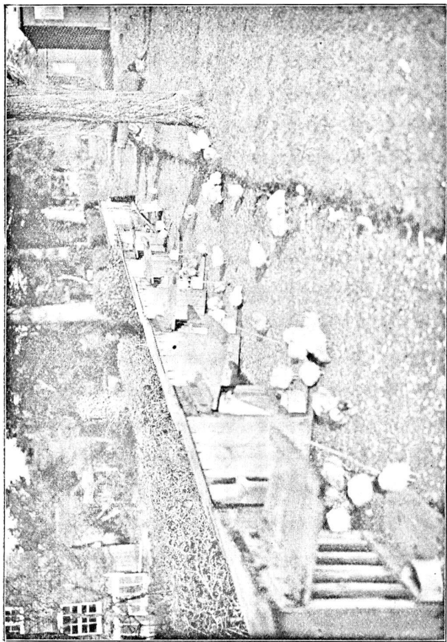
Kyllingekasser med Tremmeforside.