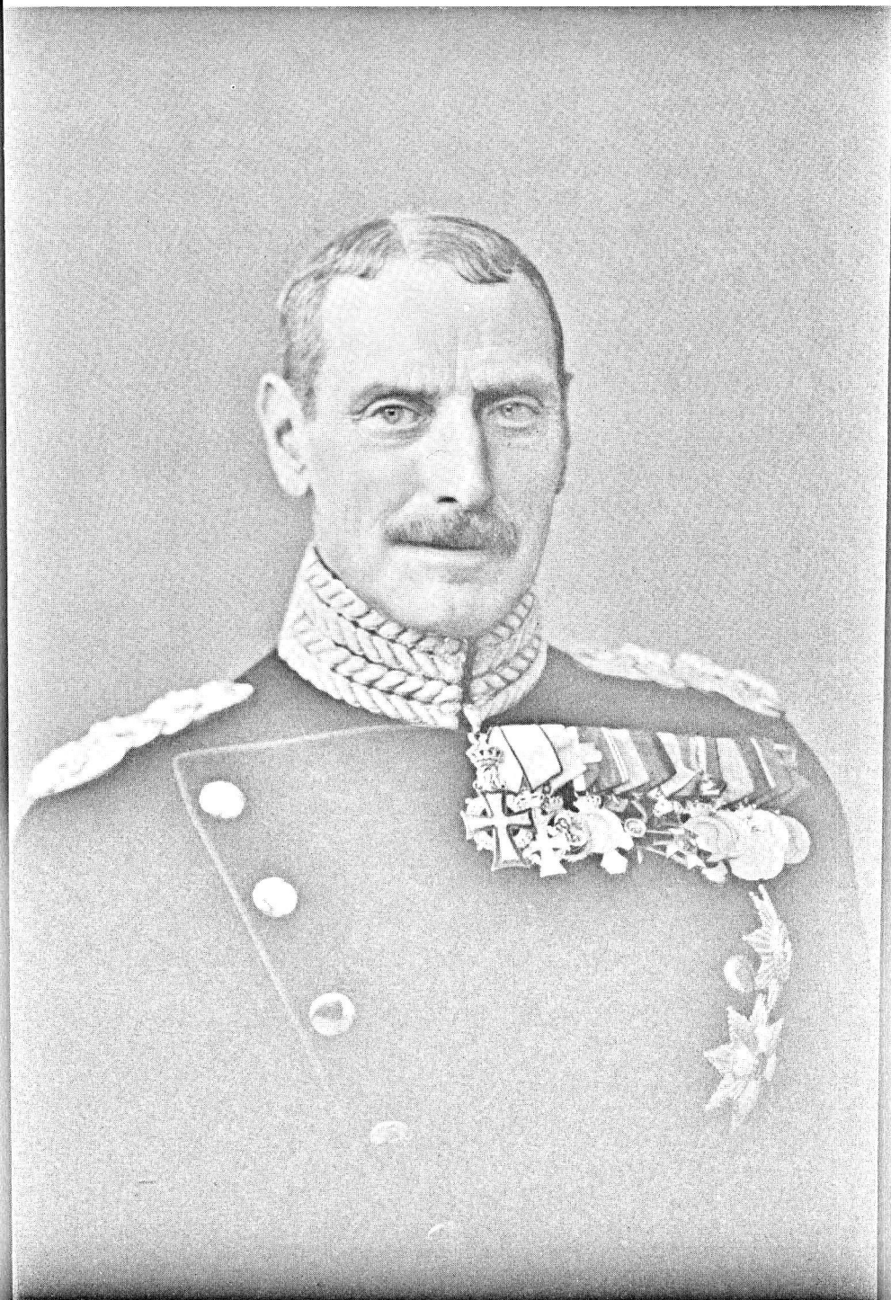
HS. MAJESTÆT KONG CHRISTIAN X 1870 26. SEPTEMBER 1940