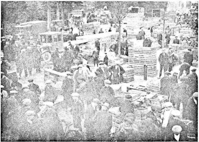
Fig. 2. Fra Fjerkræmarkedet i Barneveld.

Efter at Holland, der indtil 1907 var et ægimporterende Land, indtraadte i de ægeksexporterende Landes Række, har der kunnet spores stor Fremgang med Æggenes Kvalitet. Der findes en Form for Andelssystem paa Æggenes Omraade; i de forskellige Egne er oprettet Samlestationer, hvorfra Æggene ofte ad Kanalvej sendes til Omsætningsstedet, ligesom Æg og Fjerkræ sælges til omreisende Opkøbere, Handlende og i stor Udstrækning som Udslag af gammel Sædvane paa de i adskillige Byer afholdte ofte store ugentlige Æg- og Fjerkræmarkeder, der er karakteristiske for Holland og iøvrigt ogsaa for Belgien. Særlig kendt er Ægmarkederne