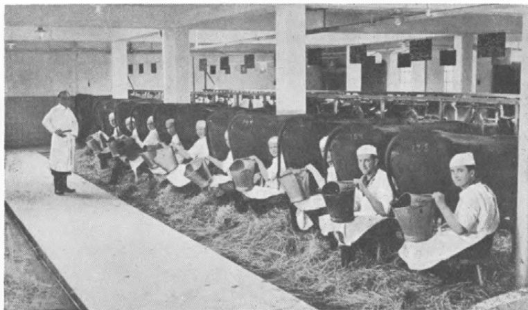
Fig. 1. Klar til at paabegynde Malkningen i Sophienborgs Stald.

var især Hensynet til Mælkens og Mejeriprodukternes Kvalitet. Kravene hertil er jo blevet større gennem Aarene og er de senere Aar blevet yderligere strammet, i 1941 f. Eks. kom der Krav om yderligere Kontrol med Eksportsmørret. Det er altsaa især fra Mejeribruget som saadant, at Kravet om Oprettelse af nævnte Konsulentvirksomhed er kommet og ikke saa meget fra Mælkeproducenterne. Dette mærkes ogsaa i Arbejdet, og det maa der tages Hensyn til ved Tilrettelæggelsen af det.