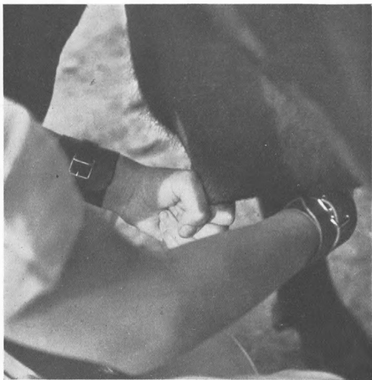
Fig. 2. Rigtig Haandstilling ved Malkning.

Ved Ansættelsen af en Konsulent er et af Spørgsmaalene: „Hvilken Uddannelse skal han have?“ Noget kunde jo tale til