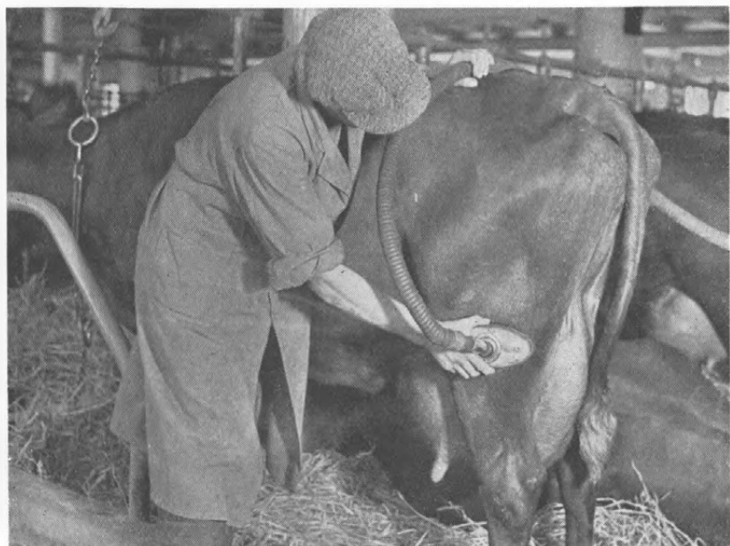
Fig. 6. Støvsugeren kan gøre god Nytte i en Kostald.

Der er en vid Arbejdsmark for en saadan Malke- og Hygiejne-konsulentvirksomhed. blot man finder den rigtige Form for