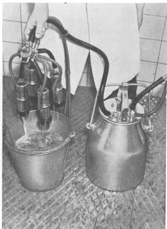
Fig. 4. Skylning af Mal- kemaskinen. Det er meget vigtigt, at denne Skylning sker straks efter Brugen.

disse Ting bliver forbedret, hjælper det oftest paa Reduktasen, saa denne Fejl er ikke saa vanskelig at afhjælpe. Værre er Smagsfejlene, som jo for en stor Del stammer fra Fodringen. Fodringen betyder meget for Mælkens Kvalitet og kan paa- virke den baade i god og daarlig Retning. Den efterhaanden ret udbredte Ensilagefodring mærkes ogsaa paa Mælkens Kvalitet. Ensilage er jo et udmærket Foder, men det kan, især hvis det er fremstillet daarligt, give Anledning til daarlig Smag i Mæl- ken. Afhjælpning af Fodringsfejl vanskeliggøres noget der- ved, at de forhaandenværende Fodermidler og især de, der giver Afsmag, jo oftest skal bruges uanset deres Tilstand. Af Hensyn til Mælkens Kvalitet er det derfor vigtigt altid at have sunde og gode Fodermidler at fodre med; og her er et