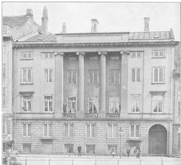
Den Ankerske Gaard. I denne Ejendom havde Selskabet til Huse i 19 Aar, efter at det i 1884 — foranlediget af Christiansborg Slots Brand — maatte fråflytte Prinsens Palæ .

1892. Selskabet nedsatte et fast Redskabs- og Maskinudvalg, der med en Statsbevilling paa 5000 Kr. aarlig paabegyndte systematiske Redskabs- og Maskinprøver til Vejledning for saavel Landmænd som Fabrikanter. I 1914 overgik Virksomheden til Staten og videreførtes som „ Statens Redskabsprøver “.