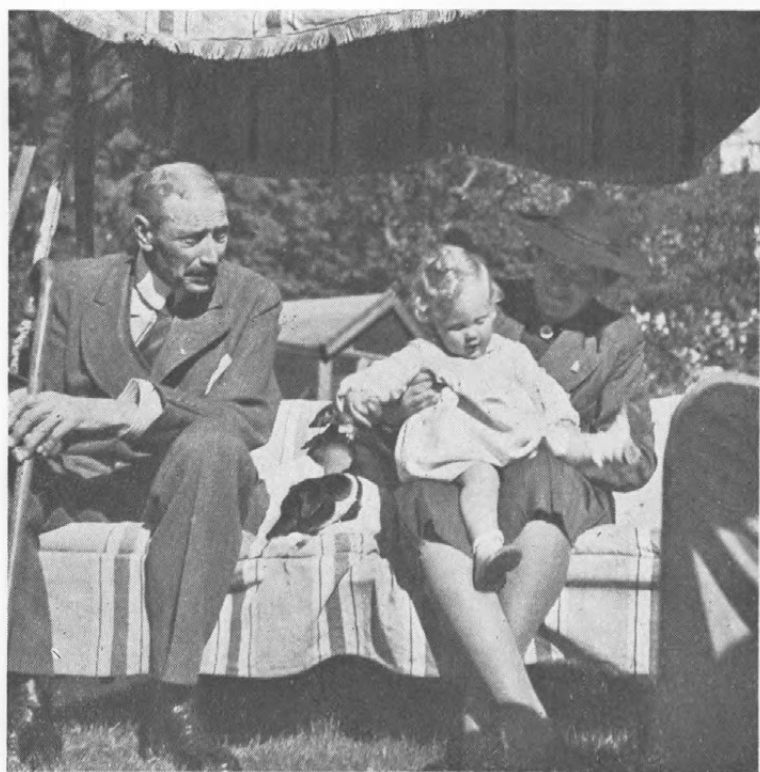
I Slotshaven ved Sorgenfri.

Særlig festlig blev den Mærkedag i Danmarks Historie, da Kongen atter kunde mødes med Regering og Rigsdag efter den lange Afbrydelse. En særlig Glæde var det for Befolkningen ud over Landet, da Kongen og Dronningen atter kunde genoptage deres Rejser til Landets forskellige Egne, saa man ogsaa her kunde faa Lejlighed til at bevidne Kongeparret sin Taknemmelighed for godt Førerskab i Ufredens Aar.