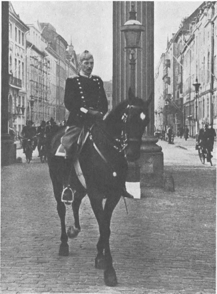
Der rider en Konge . . .

i Storbyens Trafik eller naar Kongen paa anden Maade mødtes med sit Folk.