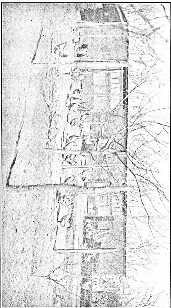
Fig. 1. Fra Avlsstationen paa »Egholt« pr. Ejby. Afdelingshønschus.