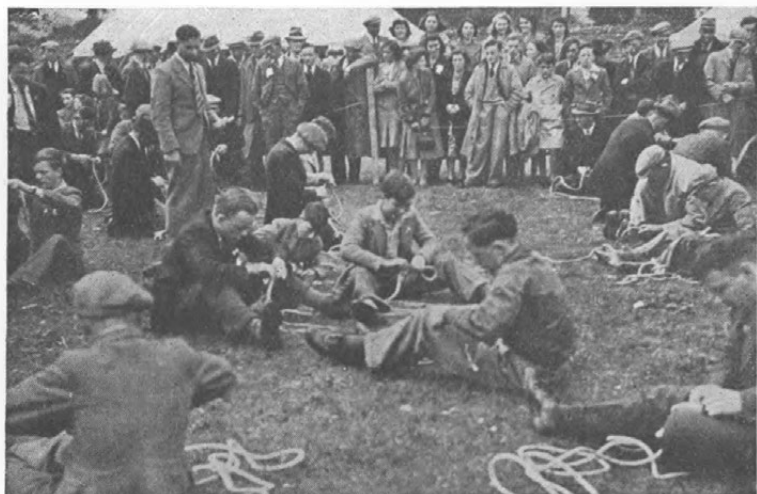
Fig. 2. Der er stor Interesse for Ungdomsarbejdet i England. Billedet viser en Konkurrence i Reb-Splejsning inden for Young Farmers Club.

ner, at smaa Landbo- og Husmandsforeninger, hvor en alsidig Konsulent virkelig havde Tid til og var indstillet paa Ungdomsarbejdet, vilde være Nr. 1. Hvorfor gennemfører man saa ikke det?