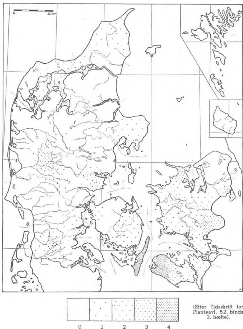
Fig. 1. Kort, der viser flyvehavrens udbredelse ud over landet. Prikkerne tæthed angiver forekomsternes hyppighed inden for et vist område.

(Efter Tidsskrift for Planteavl, 52. binds 3. hæfte).