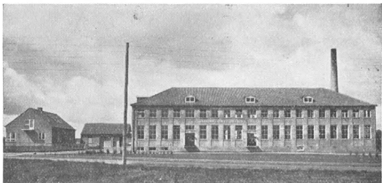
Fig. 1. Andelsmejeriet »Højbro« ved Sorø. Oprettet ved sammenlægning af Døjringe, Haugerup og Klokkebro andelsmejerier. Mejeriet, der begyndte sin virksomhed den 12. januar 1950, behandler ca. 6 mill. kg mælk årlig. Det er opført af De danske Mejeriers Maskinfabrik, der velvilligt har stillet dette og efterfølgende billeder til rådighed.

Lidt vanskeligere har forsyningen med glassager, drittelbånd o. lign. været, ligesom maskinfabrikkerne på grund af de store landes oprustning har haft vanskeligheder ved fremskaffelse af råmaterialer. Mejerierne har derfor stadig måttet vente længe, før bestilte apparater og maskiner er blevet le-