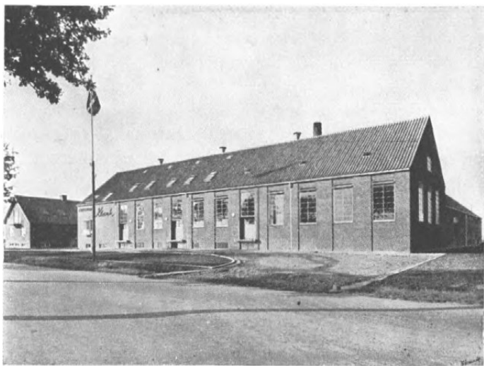
Fig. 1. Andelsmejeriet Klank. Oprettet ved sammenlægning af andelsmejerierne Marienlund og Skovlund med tilslutning af leverandører fra det nedlagte Højdal mejeri. Det nye mejeri begyndte sin virksomhed den 20. marts 1951 og behandler 8 mill. kg mælk årlig.

Også hvad det bygningsmæssige angår, er der sket fremgang. Flere nybygninger og adskillige gennemgribende ombygninger er blevet afsluttet sidste år. Ikke mindst den stærke udvidelse af osteproduktionen har bidraget til byg-