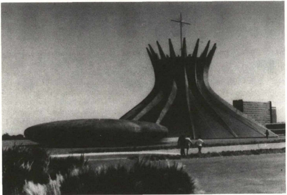
Figur 3 (Alexander Fils, s. 19, 1988)