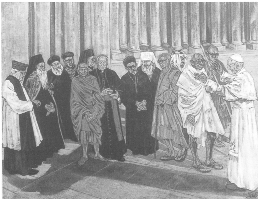
Followers of God (Oliemaleri af Dolores Puthod , 1978, i Det Pavelige Råd for den interreligiøse Dialog, Vatikanet)

Også her var det slående, hvor lidt kraft der var i de intentioner, man må have haft ved oprettelsen af Det Interreligiøse Råd. Da de skulle fortælle om deres arbejdsområder, hørte vi om et hus i Indien, hvor beboerne, til trods for at de tilhørte fire forskellige verdensreligioner, var i stand til i fællesskab at bestille en elektriker. Jeg kunne nok komme på et sted ikke helt så langt fra Vatikanet, ja faktisk lige på den