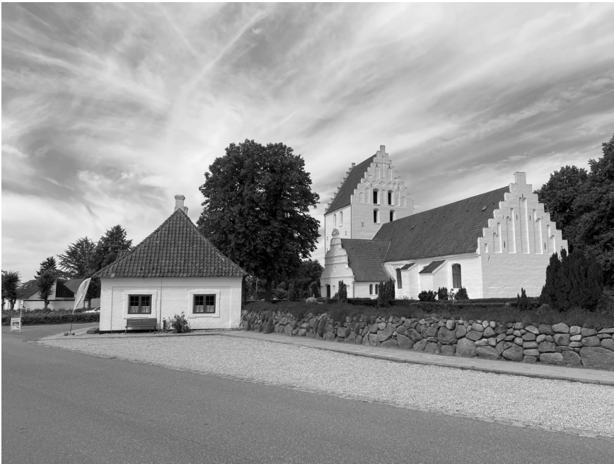
Godshospitalet i Otterup oprettet i 1722 af Christian Sehested og Charlotte Amalie Gersdorff. Hospitalet blev opført nær kirken i grundmur og fik navnet Frelsens Hospital. På hospitalet var der plads otte fattige, to og to i hvert kammer med mænd og kvinder for sig. Derudover var der køkken, loft og have, hvor beboerne kunne dyrke kål og andre køkkenurter.

imod Gud, for hans mangfoldige Rige og runde Velsignelser”, at han kom de ”nødlidende Christne til Hielp og Undsætning i deres Armod” for dermed at stifte to hospitaler i henholdsvis Munkebo og Seden sogn. 54