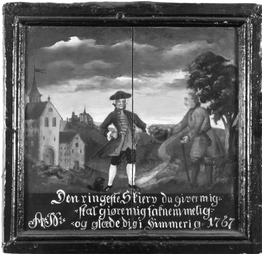
En adelsmand giver almisse til en fattig tigger. Maleri formentligt fra en pengeblok fra Skt. Laurentii Kirke i Kerteminde.

førte et "Christeligt, Gudeligt og skikkeligt Levnet". 71 Der var dermed et klart modsætningsforhold mellem acceptable, kristelige handlinger og det, der blev opfattet som amoralsk og ukristelig opførsel. Det var godsejernes pligt at sikre sig, at hospitalslemmerne levede et fromt, kristeligt liv, mens de var på det patrimoniale herskabs hospital.