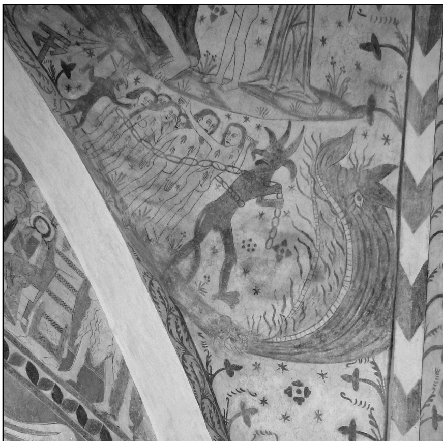
ILLUSTRATION 2: Helvedesgabet, udsnit af dommedagsmotiv, ca. Keldby kirke, ca. 1500-1520.

tabtes ansigter. Det lignede det pinefulde sted, som fortælleren i pamfletten Helvedes Badstue blev taget med til. 50